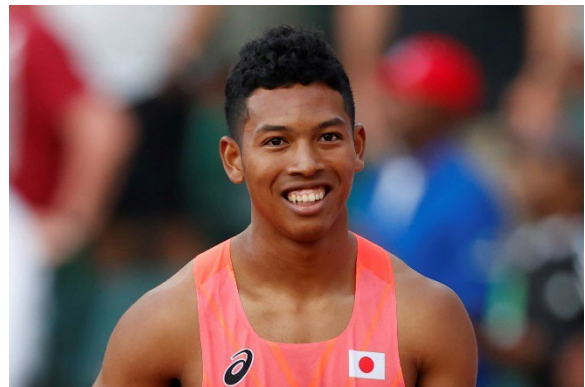
サニブラウン アブデル ハキーム選手

注目のサニブラウン アブデル ハキームは、昨年の世界陸上で過去最高6位入賞と勢い十分。オリンピックで決勝に進めば、日本勢92年ぶりの歴史的偉業となる。そして人類最速の大本命は、世界陸上3冠の超人ライルズ。男子では、あのボルト以来となるオリンピック3冠を見据え、パリの100mに臨む。