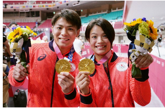
阿部一二三選手・阿部詩選手 東京五輪で史上初の兄妹同日金メダル

東京五輪では五輪史上初となる兄妹同日の金メダル獲得。共に豪快な柔道を武器に目指し続けてきた「2人で連覇」へ。世界一の競技人口を誇る柔道大国フランスの畳に立つ。