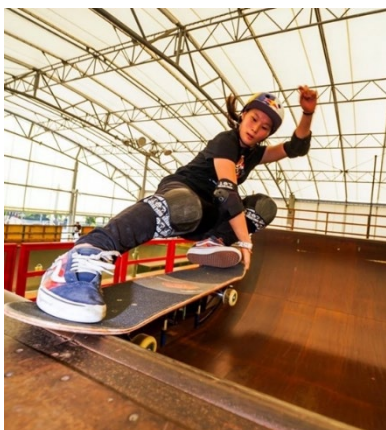
四十住さくら選手

3年前、四十住さくらが金メダルに輝いた東京五輪で、“仲間と楽しむ”その世界観が大きな話題を呼んだスケートボード女子パーク。連覇を狙う四十住に加え、ともに15歳の世界女王・開心那&アジア女王・草木ひなのも出場濃厚で、再びニッポン旋風の予感大。