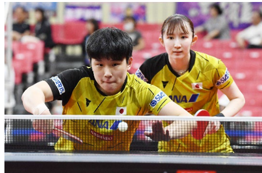
張本智和選手、早田ひな選手

東京で金メダリストとなった水谷隼・伊藤美誠に続く日本勢2大会連続のメダル獲得へ。勝てばメダルが決まる準決勝に挑む！